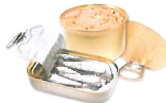
Conserves de poisson ou de viande