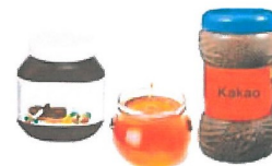
Pâte à tartiner - Miel Cacao