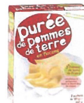
Purée de pommes de terre en flocons